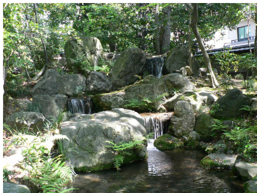
疏水の水が導入される三段の滝

この造庭の鍵となったのは、西大津から山科疏水を経由して蹴上台地に運ばれた疏水の水を鉄管で引水したことである。これを借景となる東山連峰の南禅寺山からの水として3段の滝として庭の隅に落として川とし、傾斜地を利用して芝生で敷き詰められた山並みの間を縫い、川幅を広げながら海に向かってせせらぎの流れを演じている。周辺は樹木で覆われ、苔が配置されており、都会の中とは思えない自然環境が作られている。