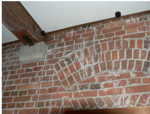
明治31年に建設された洋館内部

洋館内部についてはフラッシュ撮影禁止となっており、有名な「無鄰菴会議」が開催された洋館2階の様子を紹介できないのが残念である。